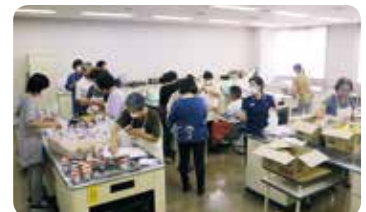
8月8日(土)に実施したフードギフトの準備の様子

新型コロナウイルス感染防止のため食事の提供が難しい中で、子どもの支援をする方法が他にないかを検討しています。支援をいただける方々とも手をつなぎ、子どもが健やかに育つよう微力を尽くしていきたいと思っています。