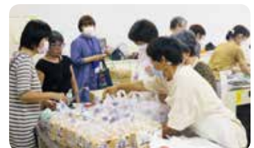
おやつや食材を一人分ずつ袋へ