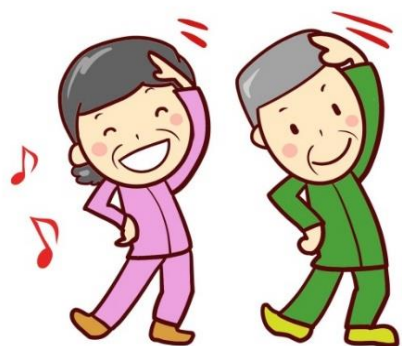
(いきいき健康体操)

人生100年時代！ 元気づくりは大事なテーマです。 元気づくりには、「きょういく」と「きょうよう」が大切です。 「今日行く（きょういく）場所」をつくり、「今日用（きょうよう）がある」毎日が、 皆さんの健康づくりにつながります。元気づくりの「お出かけ先」、それが「粋な 西尾道場」です。ぜひご活用ください！！