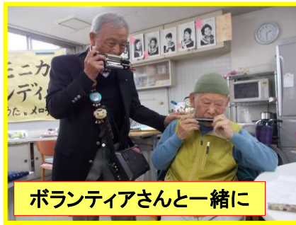
ボランティアさんと一緒に