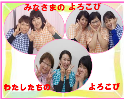
みなさまのよろこび