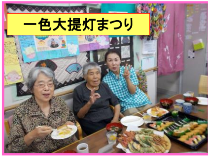
一色大提灯まつり