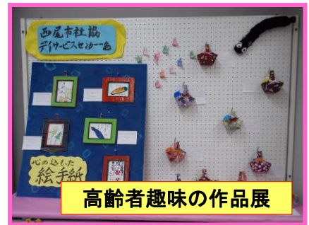
高齢者趣味の作品展